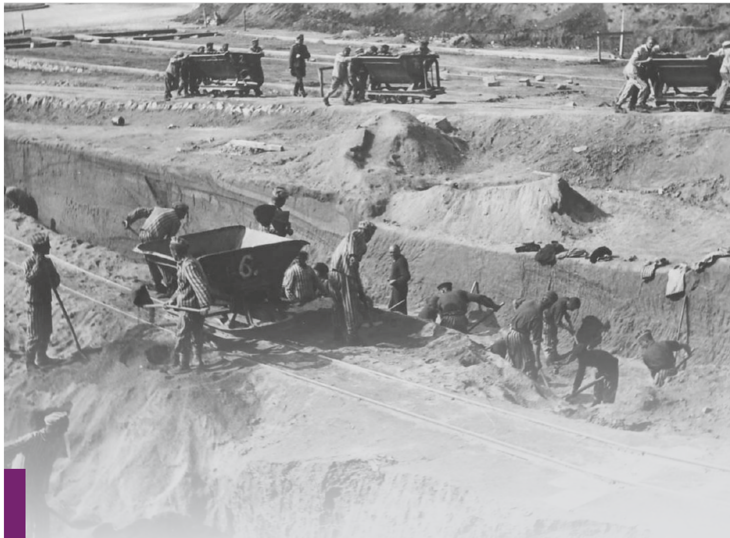
Więźniowie obozów koncentracyjnych Mauthausen podczas robót ziemnych, 1942