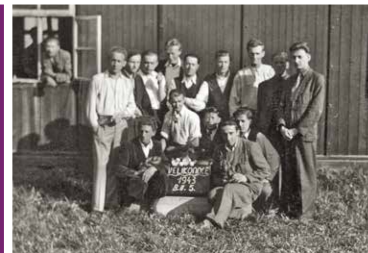
Czescy robotnicy cywilni, koszary w Linzu, 1943

Ludność cywilna z całej Europy była zmuszana do pracy za pomocą rekrutacji, przymusu, fałszywych obietnic lub arbitralnej przemocy i nalożów. Obywatele zaprzyjaźnionych narodów mieli być traktowani jak niemieccy robotnicy, podobnie jak Włosi do września 1943 r., wszyscy pozostali według kryteriów rasowych ( tablica 7 wystawy).