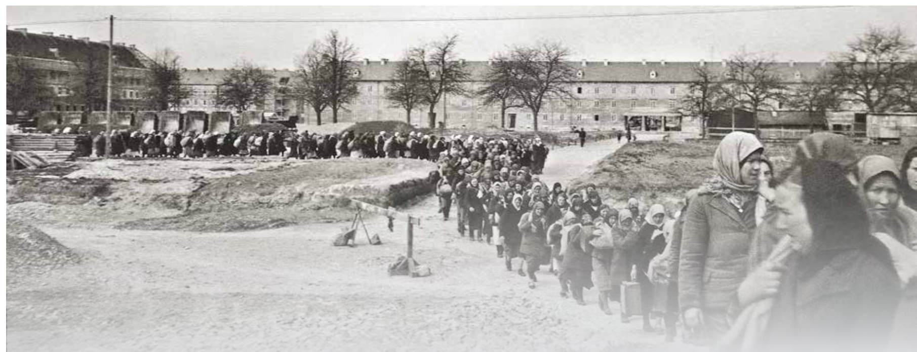
Robotnicy przymusowi z Europy Wschodniej w Linz