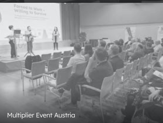
Multiplier Event Austria