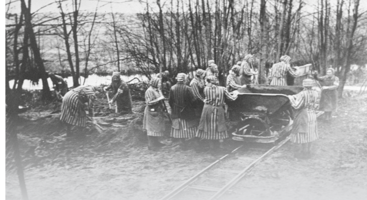
Więźniarki obozu koncentracyjnego Ravensbrück

Wystawa skierowana jest przede wszystkim do uczniów powyżej 14 roku życia, co oznacza, że jest dostępna dla szkół, ale także dla stowarzyszeń, instytucji publicznych i ogółu obywateli. Temat pracy przymusowej jest mało dyskutowany, co pozwala na prezentację wystawy w różnych kontekstach. Aby wesprzeć nauczycieli w pracach przygotowawczych, udostępniono wytyczne dotyczące nauczania. Takie podejście ma na celu stymulowanie krytycznego myślenia i promowanie świadomości historycznej wśród różnych grup docelowych.