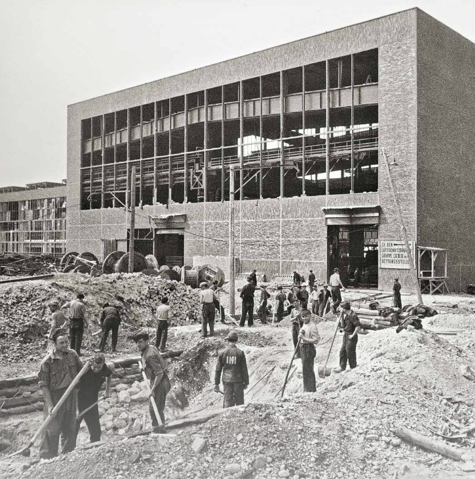
Robotnicy przymusowi oznaczeni literami IMI (włoscy internowani wojskowi) podczas usuwania bomb w Linzu