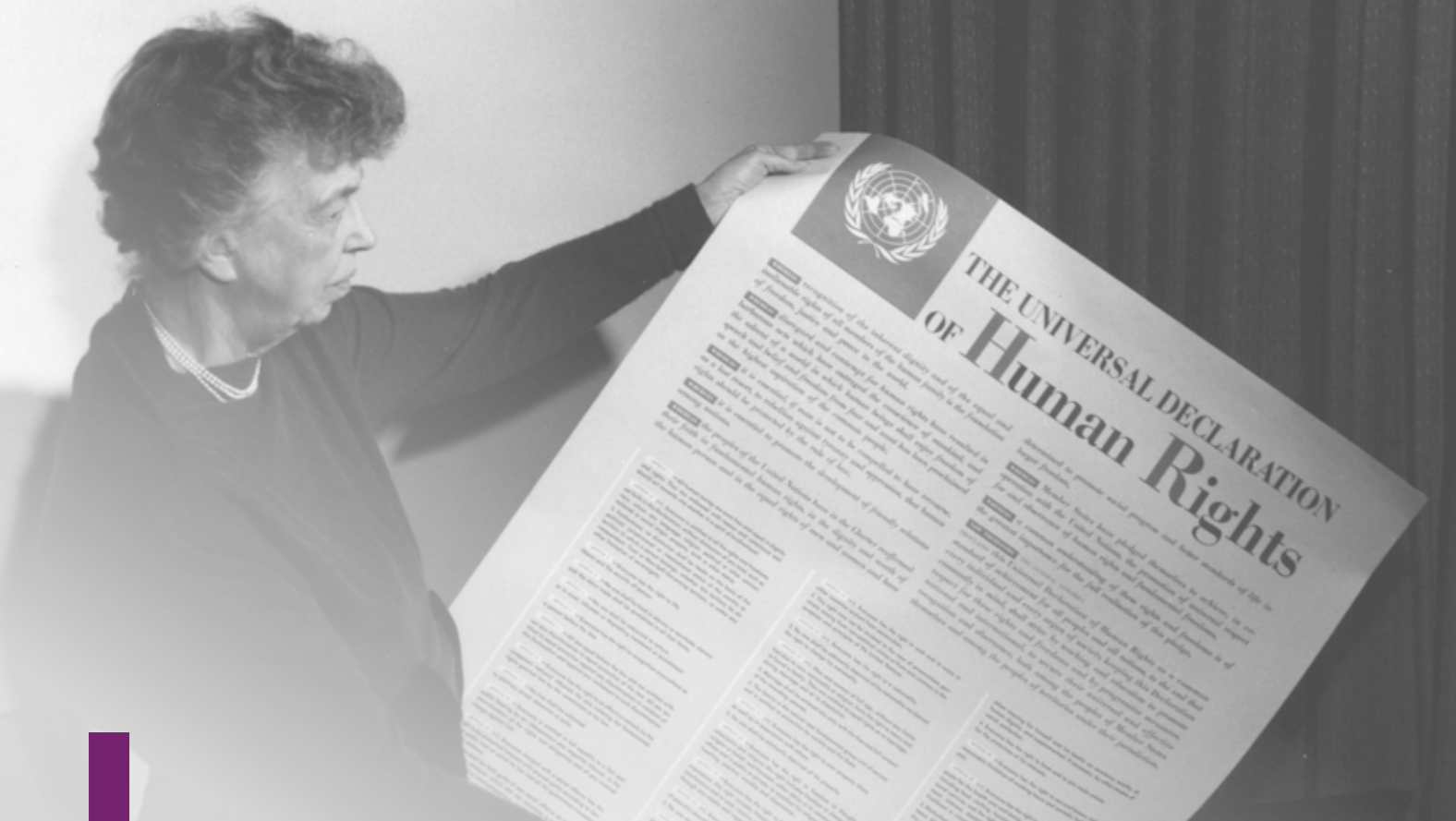
Eleanor Roosevelt jako członkini Komisji Praw Człowieka ONZ zaangażowana w przygotowanie „Powszechnej Deklaracji Praw Człowieka” – prezentuje tekst Deklaracji, 1949