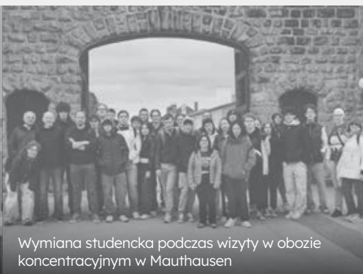
Wymiana studencka podczas wizyty w obozie koncentracyjnym w Mauthausen