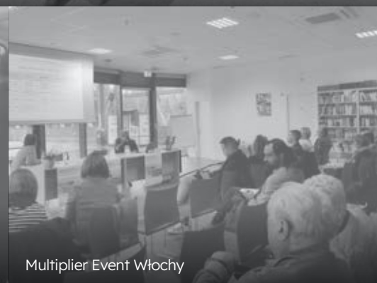
Multiplier Event Włochy

Wystawa powstała w ramach projektu Erasmus + zatytułowanego „ FORCED LABOUR . Development of an Exhibition and Pedagogical Materials for Schools” we wspólnym procesie z uczestnikami z następujących organizacji: