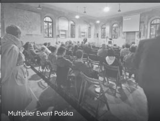
Multiplier Event Polska