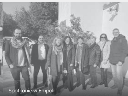
Spotkanie w Empoli