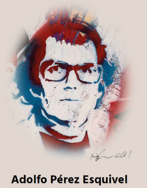
Adolfo Pérez Esquivel

Who do you think of when you hear the term human rights?