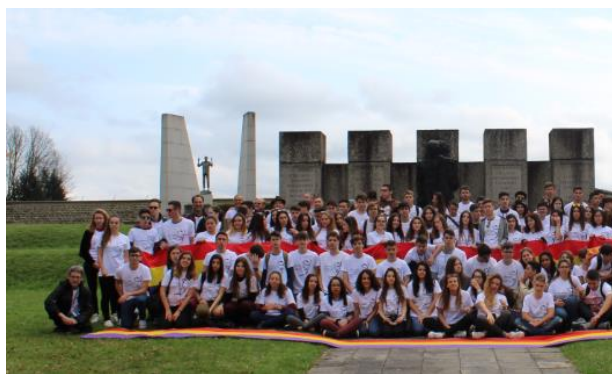
Fotografía de grupo realizada después de finalizar el acto de homenaje en Mauthausen.

En paralelo a este gran acto, los estudiantes tienen encomendadas otras tareas a realizar, que varían en función del criterio de cada instituto y de cada profesor. Muchas de ellas, sin embargo, están vinculadas a recoger testimonio escrito o gráfico de la experiencia. Porque termina el viaje, pero no el proyecto.