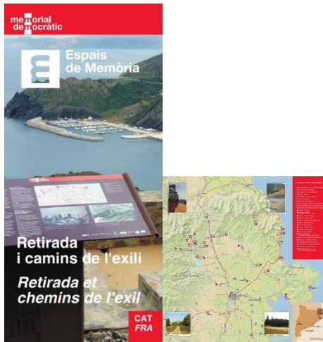
Tríptico de información de los espacios de memoria vinculados a los caminos del exilio alrededor del MUME.