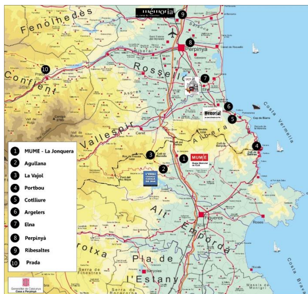
Mapa de los espacios de memoria del exilio republicano alrededor del MUME i de los principales centros de interpretación i memoriales de la zona transfronteriza entre la comarca del Empordà (Cataluña-España) y el Departamento de los Pirineos Orientales (Francia). Mapa: MUME / Generalitat de Catalunya, Casa a Perpinyà, 2007.