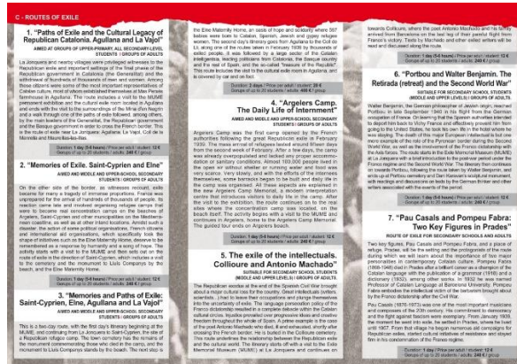
Tríptico de información de las 7 rutas del exilio del MUME

Actualmente se proponen siete opciones distintas, algunas de ellas derivan directamente de la propuesta pedagógica de la Universidad de Girona, mientras que el resto surgieron de la voluntad de completar este trabajo, incluyendo exilios concretos y específicos, pero muy significativos, como los de Pau Casals y Pompeu Fabra en Prades de Conflent, la estancia y muerte de Antonio Machado en Collioure y el también fallecimiento de Walter Benjamin en Portbou, ya durante la Segunda Guerra Mundial. A estas propuestas hay que añadir, entre otras, las rutas de cariz conmemorativo que el museo organiza en momentos especialmente significativos, como fueron el 70 y el 75 aniversario de la retirada republicana o el recuerdo que anualmente en la población de Portbou se rinde, junto a la Cátedra Walter Benjamin de la Universitat de Girona, al filósofo alemán Walter Benjamin, entre otros.