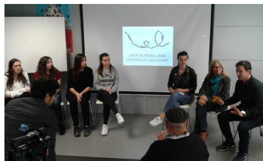
Rueda de prensa de presentación del viaje del curso 2016-2017.

Por último, justo antes de emprender el viaje, los alumnos participantes son los encargados de realizar una rueda de prensa dirigida a los medios de comunicación locales, donde presentan el proyecto y exponen sus expectativas antes de empezar una experiencia que, tal como muchos ya se esperan, les cambiará en muchos sentidos.